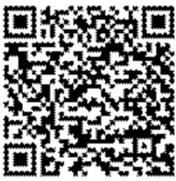
QR-Code für Android