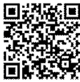
QR-Code für iOS